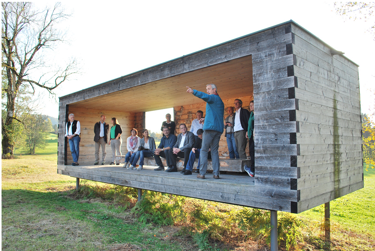
Exkursionen in Vorzeigeorte bieten die Chance neue Perspektiven kennenzulernen Foto: LandLuft Exkursion Vorarlberg mit dem Landkreis Rottal-Inn 2017 © LandLuft

Die Strategie wird ausformuliert, anschaulich aufbereitet und bis Ende 2022 öffentlich präsentiert. Schriftlich zur Verfügung gestellt, soll sie allen Kommunen, Landkreisen und Institutionen im Projektgebiet als Orientierungshilfe und Leitfaden für sämtliche zukünftige Tätigkeiten im Bereich Baukultur dienen. Es ist ausdrückliches Ziel, auch andere Gemeinden aus der Region durch den baukulturellen Schneeballeffekt mit auf die gemeinsame Reise zu nehmen.